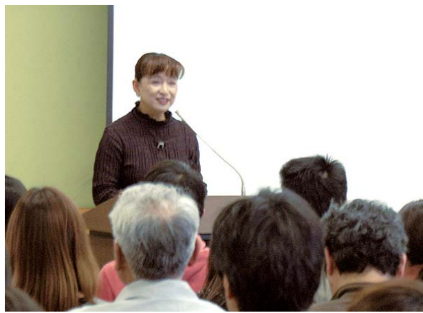
講演する腹巻さん